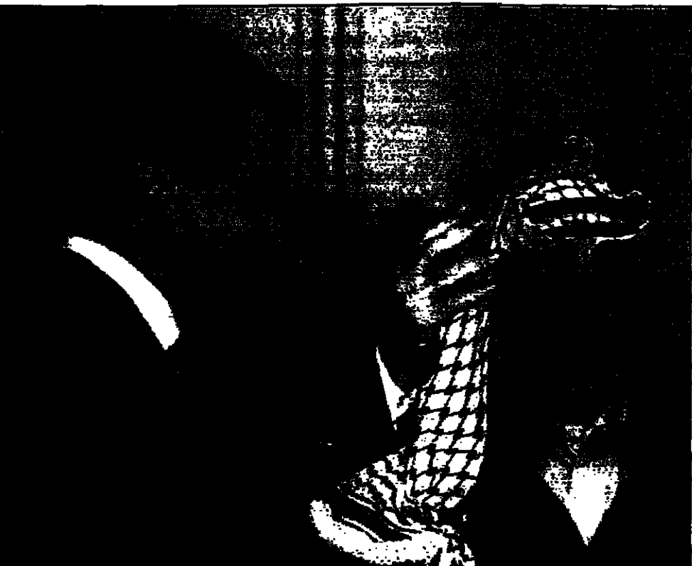
رئيس الوزراء الاسرائيلي يرحب بعرفات في حيفا